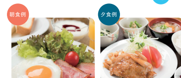
朝食は洋食か和食か選べます。

栄養バランスのしっかりしている食事を摂ることはとても大切です。学生会館では、食事の準備や後片付けが不要で、おいしいごはんを食べられるのがうれしい！ 飽きのこないメニューを提供しています。