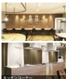
キッチンコーナー