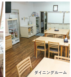
ダイニングルーム